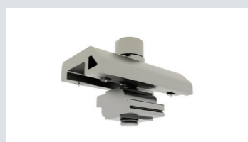
アースピン付き T レールクランプ