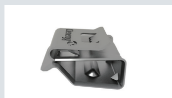
ユニバーサル ケーブルホルダー 2本用