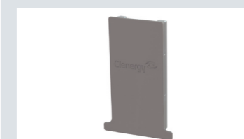
T110 レール キャップ