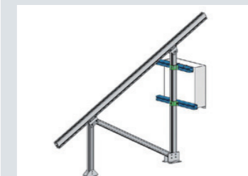
ソーラーテラス III-A 接続箱取付け用ブラケット