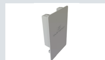
ガーダーキャップ