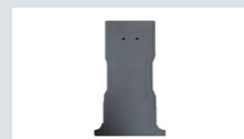
T140 レール キャップ