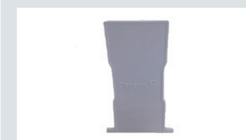
T160 レール キャップ