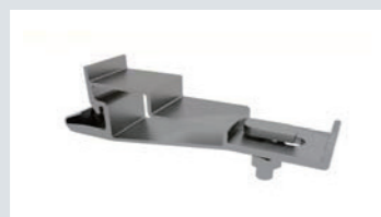
ケーブルダクト クランプ