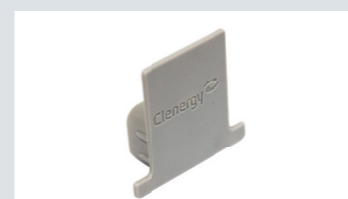
T50 レール キャップ