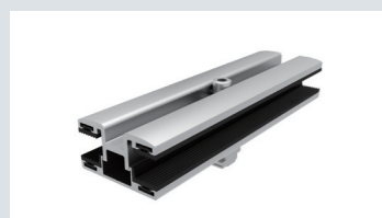
6mm フレームレス用ミドルクランプ