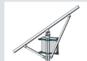
ソーラーテラス II-A (ダブルサポート) 接続箱取付け用ブラケット