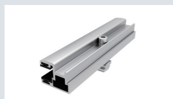
6mm フレームレス用エンドクランプ