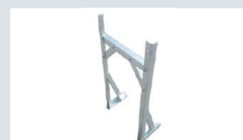
自立式接続箱取付け用ブラケット