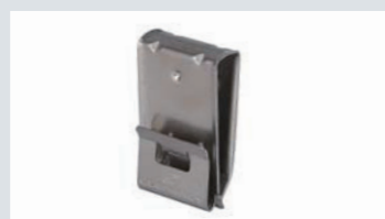
ユニバーサル ケーブルホルダー 4本用