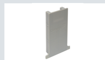
T105 レール キャップ